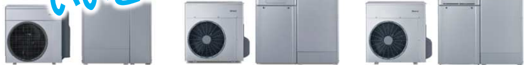
ECO ONE 160L